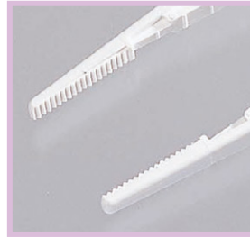
無鉤タイプ (滅菌M・Lセッシ)