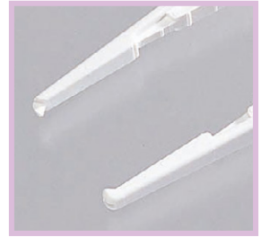
有鉤タイプ (滅菌Mセッシ)